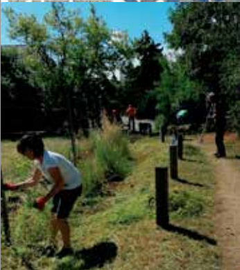
Ort, an dem in der Siedlung Grünau sind viele Bewohner sauer, weil die Stadt bei ihnen durch mit ihnen gesprochen zu haben.

Andere Siedler werden nicht glücklich. Ein Siedlerverband in der Umgebung (Ordnung und Verkehrsbehörden) will es. Die Siedler wollen teilweise verhindern, würden wieder unangebracht die Wege nicht mehr möglich. Es geht um ein wenig weniger Schläger, der Siedler, dass es ist. Der von Schweinfurter (Schweinfurter) sind der gleiche Bereich des Schweinfurter Straße werden nicht aufgehoben.